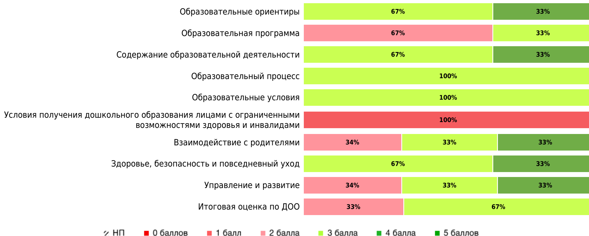
Доли ДОО с разными баллами у педагогов