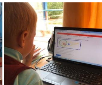
Кружок «Математика в искусстве»