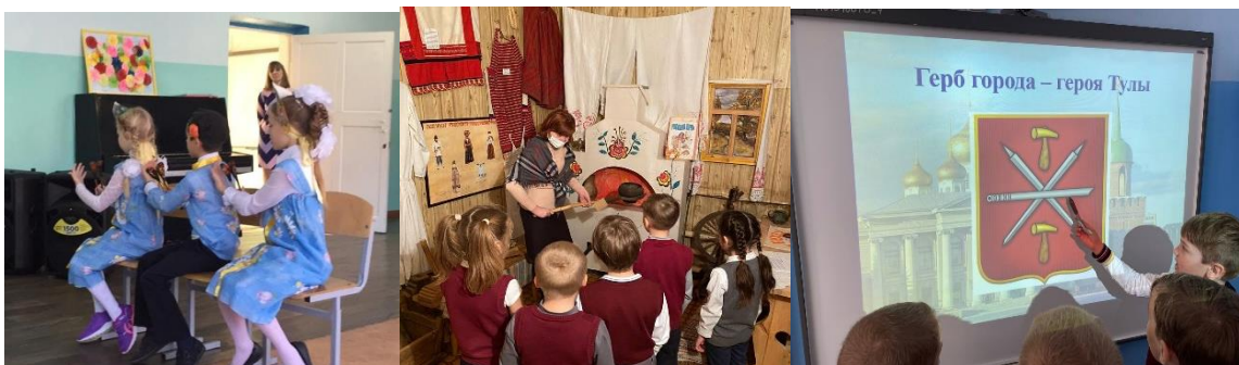
Кружок «Тропинки Родины моей»

Туристско-краеведческая деятельность. Курсы внеурочной деятельности и дополнительного образования, направленные на воспитание у школьников любви к своему краю, его истории, культуре, природе, на развитие самостоятельности и ответственности школьников, формирование у них навыков самообслуживающего труда: «Русская изба», «Тропинки Родины моей», «Добро пожаловать в Тулу».