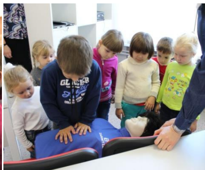
Кружок «Научись спасать жизнь»