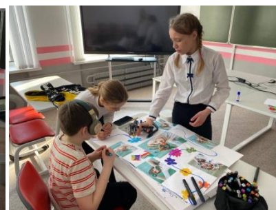
Кружок «Фотостудия «PAPARAZZI»

Проблемно-ценностное общение. Курсы внеурочной деятельности и дополнительного образования, направленные на развитие коммуникативных компетенций школьников, воспитание у них культуры общения, развитие умений слушать и слышать других, уважать чужое мнение и отстаивать свое собственное, терпимо относиться к разнообразию взглядов людей: «Азбука нравственности», «Человек и профессия», «В мире книг», «Книжный мир», «Научись спасать жизнь».