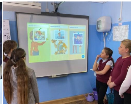
Кружок «Человек и профессия»