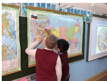
Кружок «Юный топограф»

Познавательная деятельность. Курсы внеурочной деятельности и дополнительного образования, направленные на передачу школьникам социально значимых знаний, развивающие их любознательность, позволяющие привлечь их внимание к экономическим, политическим, экологическим, гуманитарным проблемам нашего общества, формирующие их гуманистическое мировоззрение и научную картину мира: «Английский с удовольствием», «Математика в искусстве», «Юный топограф», «Облачная информатика» и др.