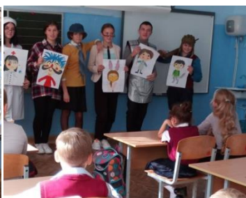
Кружок «Английский с удовольствием»