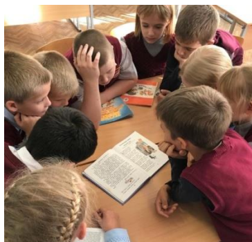
Кружок «В мире книг»

Проблемно-ценностное общение. Курсы внеурочной деятельности и дополнительного образования, направленные на развитие коммуникативных компетенций школьников, воспитание у них культуры общения, развитие умений слушать и слышать других, уважать чужое мнение и отстаивать свое собственное, терпимо относиться к разнообразию взглядов людей: «Азбука нравственности», «Человек и профессия», «В мире книг», «Книжный мир», «Научись спасать жизнь».